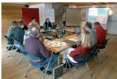
Die Förderung beruflicher Weiterbildungsmaßnahmen ist in den letzten Jahren erheblich zurückgefahren worden.

Maßnahmen der aktiven Arbeitsmarktpolitik sind, im Gegensatz zu passiven Maßnahmen der Alimentierung von Arbeitslosen, darauf ausgerichtet, die Chancen der Eingliederung in den ersten Arbeitsmarkt zu erhöhen (► FbW, ► TM). In geringerem Umfang sollen zudem subventionierte Beschäftigung geschaffen (► ABM, ► SAM) oder die Mobilität (Selbstständigkeit, beruflich bedingte Umzüge) gefördert werden.