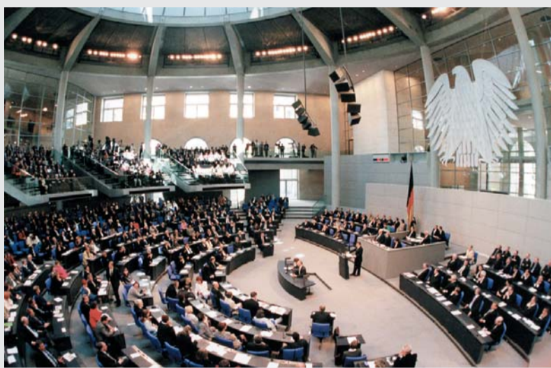
Einweihung des Planarsaals im Reichstagsgebäude in Berlin am 19.04.1999

In der sowjetischen Besatzungszone konstituierte sich der 2. Deutsche Volksrat als Provisorische Volkskammer und setzte am 7. Oktober 1949 die Verfassung der Deutschen Demokratischen Republik in Kraft. Mit der Gründung der DDR erhielt Berlin (Ost) den Status der Hauptstadt, obwohl die Verfassung der DDR aufgrund des Viermächtestatus für Berlin nicht im Ostsektor galt. Nach dem Mauerbau wurde Ost-Berlin als Hauptstadt zum 15. Bezirk der DDR erklärt.