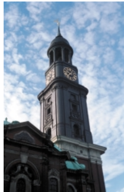
Michaeliskirche in Hamburg

fortifikatorisch – der Befestigungsanlage dienend