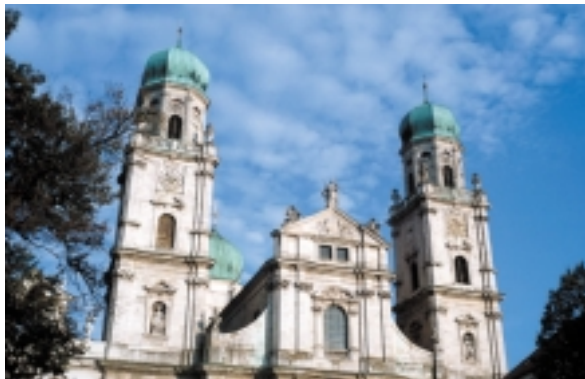
Der Dom in Passau

Die Epoche des Barock begann Ende des 16. Jahrhunderts in Italien und breitete sich von dort in Europa aus. Kunst und Architektur wurden als Mittel der Gegenreformation benutzt, den Gottesdienst mit illusionistischen Mitteln als Fest zu inszenieren. Von der Kirche wurde die Kraft der ästhetischen Wirkung zur Werbung für ihre Lehre eingesetzt: mittels Farben- und Formenreichtum setzte man sich von den asketischen reformierten Lehren ab. Gotteshäuser waren in jener Zeit mehr als bloße Versammlungsräume für die Gemeinden. Es wurde ein Fest gefeiert, und die Heiligen waren in Bildern und Skulpturen präsent. Feste, Pomp, Lust an der Illusion, Zeremoniell und Festarchitekturen sind charakteristische Phänomene für die barocke Epoche. Architektur wurde zum Bühnenbild des demonstrativen Repräsentierens der weltlichen und kirchlichen Fürsten.