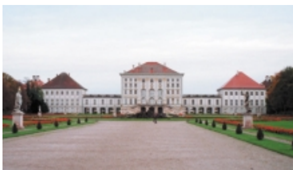
Schloss Nymphenburg in München