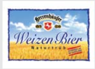
Herrenhäuser WeizenBier Hannover „nordisch by nature“