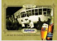
Landskron Pilsner Görlitz