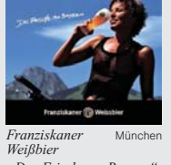
Franziskaner Weißbier München „Das Frische an Bayern“