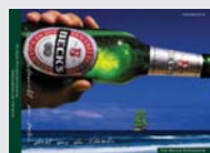
Beck's Bremen „Der pure Pilsengeschmack - grenzenlos frisch“