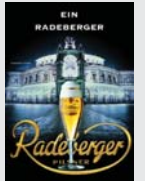
Radeberger Pilsner Radeberg „Ein Radeberger“