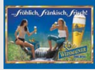
Weismainer Pils-Bräu Weismain „... fröhlich, fränkisch, frisch!“