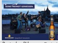
Rostocker Pilsener Rostock „Sympathisch hanseatisch.“