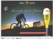
Teutsch Pils Kempten „Komm nach Haus.“