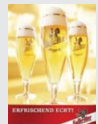
Hasseröder Pils Wernigerode