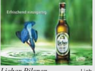
Licher Pilsner Lich „Aus dem Herzen der Natur“