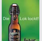
Darmstädter Braustüb'l Darmstadt „Die Lok lockt! Die Brauerei mit Pfiff.“