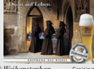
Weihenstephan Freising „Ursprung des Bieres“