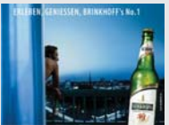
Brinkhoff's No. 1 Dortmund