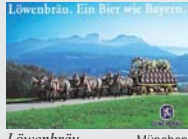
Löwenbräu München „Ein Bier wie Bayern.“