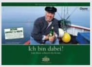
Jever Pilsener Jever „Wie das Land, so das Jever. Friesisch-herb.“