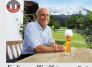
Erdinger Weißbier Erding