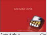
Früh Kölsch Köln