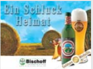
Falkensteiner Ur-Weiße Winnweiler „Ein Schluck Heimat ... natur-verwöhnt vom Donnersberg“