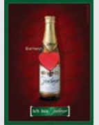
Freiburger Pilsner Freiburg „Ich bin Freiburger“