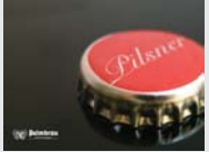
Palmbräu Pilsner Eppingen „Stolz des Kraichgaus“