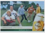
Freiburger Pils Freiberg „Jetzt das Allerbeste... Sächsisch, köstlich.“