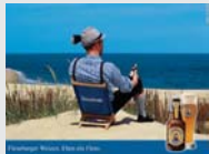
Flensburger Weizen Flensburg „Eben ein Flens“